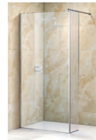
CHIANTI ALLETTA FISSA LATERALE