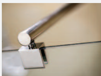
BARRA DI SUPPORTO CROMATA